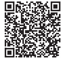
Rotierend Polieren: Klinisch basiert