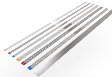
Strips and Saws