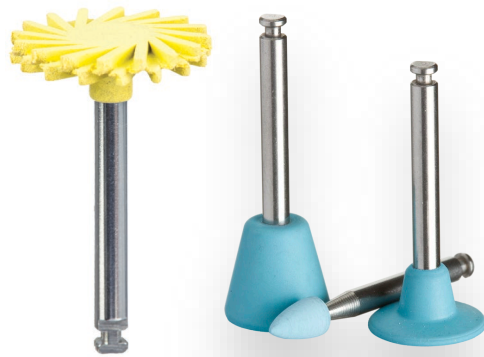
Polishing Cups, Points, Disks, etc.